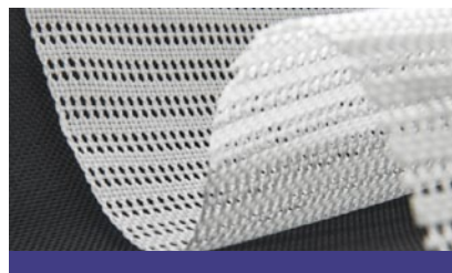
LECO Tex Multifil