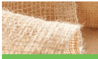
LECO Tex Naturfaser | Natural fibre

LECO-Werke Lehtreck GmbH & Co. KG Hollefeldstr. 41 48282 Emsdetten Germany