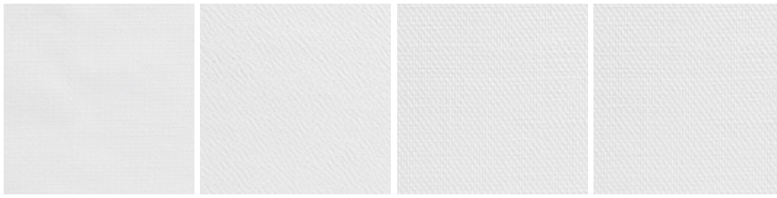
61100 Glasgewebe Glass fibre 61120 Glasgewebe Glass fibre 61140 Glasgewebe Glass fibre 61150 Glasgewebe Glass fibre